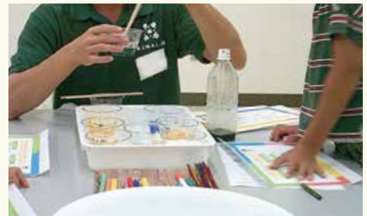
こちらは BTB 溶液を使った実験。 この液体は酸性かな、アルカリ性かな?

夏休みの図書館は、宿題のための資料をお探しのお子さんで毎年にぎわいます。来年の夏も、宿題に悩むみなさんのお力になれるように、東和図書館は陰ながら尽力していきます。