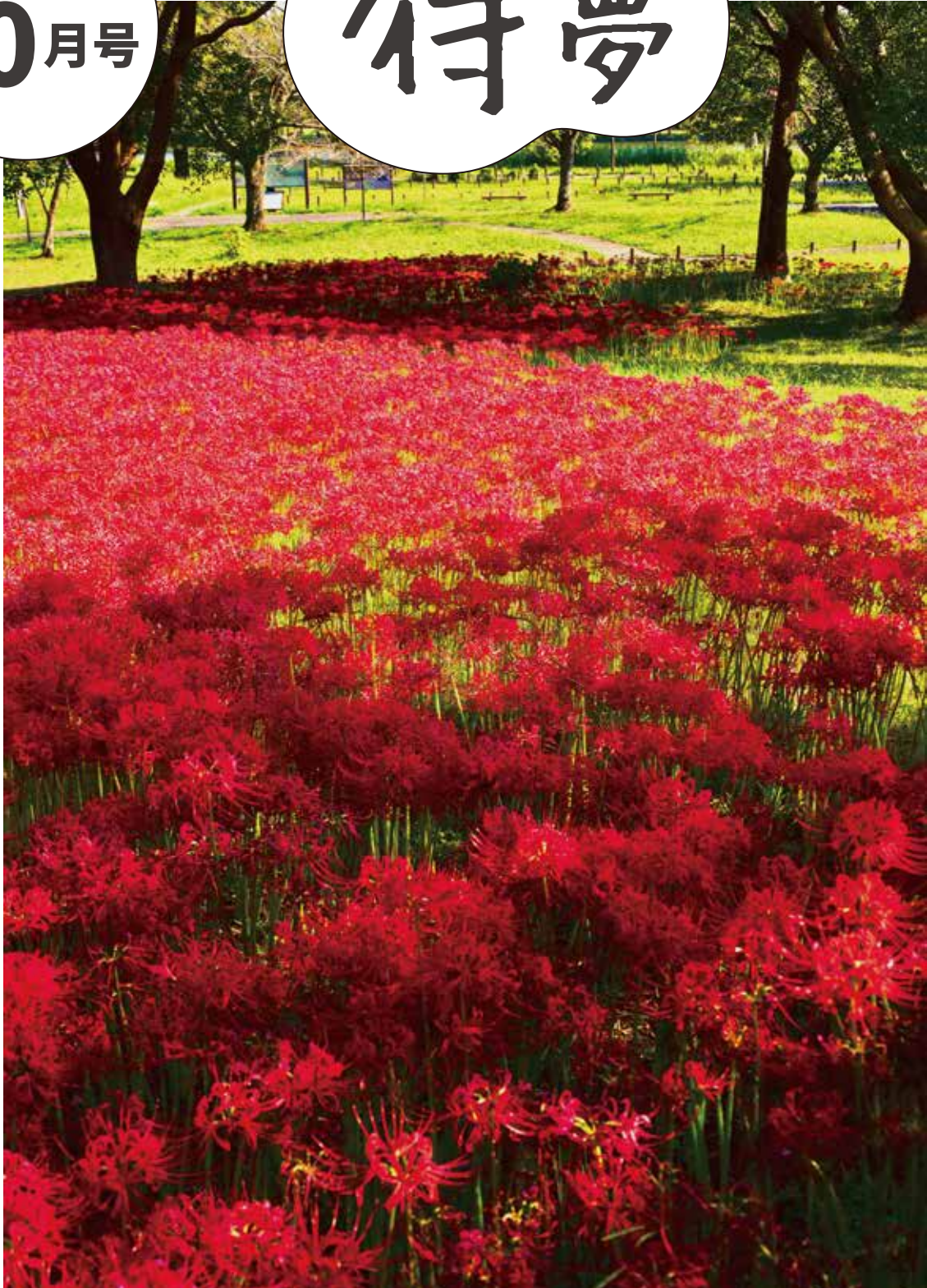
撮影地：東京都葛飾区 水元公園

東和だより (P2~3)・講座イベント情報 (P4~6)・カラダに効くトピックス (P7)・ 図書館情報 (P8~9)・住区センター情報 (P10)・東和センターカレンダー (P11)