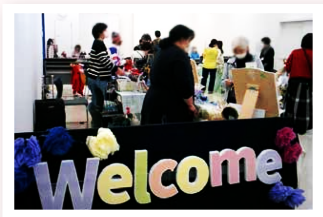
昨年の開催の様子