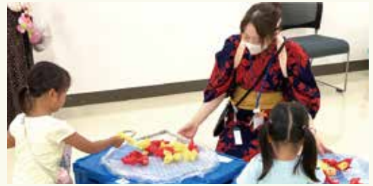
金魚すくいならぬ、火の玉すくいに熱中!

室内での夏祭りを楽しむお子さんの様子を写真に撮って、親御さんたちにもこやかに過ごされていました。東和図書館では今後も楽しい親子向けイベントを開催していきますので、ぜひお気軽にご参加ください。