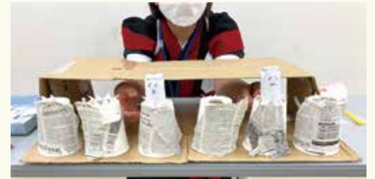
おぼけたたきは手動なので、スタッフの腕力が試されました。