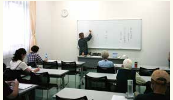
先生のお話を熱心に聴いています

短時間の講座ではありましたが、それぞれのペースで短歌づくりを楽しんでいただけたようです。このように言葉と対話する穏やかな時間を、東和図書館では今後お届けしていきますので、どうぞご期待ください。