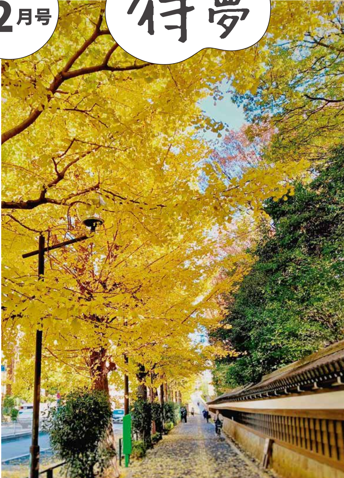
撮影地：東京都文京区 小石川後樂園

東和だより (P2~3)・講座イベント情報 (P4~6)・カラダに効くトピックス (P7)・ 図書館情報 (P8~9)・住区センター情報 (P10)・東和センターカレンダー (P11)