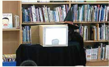
箱の中身はなんだろう？

引き続き東和図書館では、親子で楽しんでいただけるような季節イベントを開催していきます。