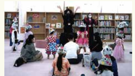
帽子が完成！いろんな顔のユニークな帽子がたくさん