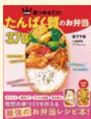
『たんぱく質のお弁当 378』