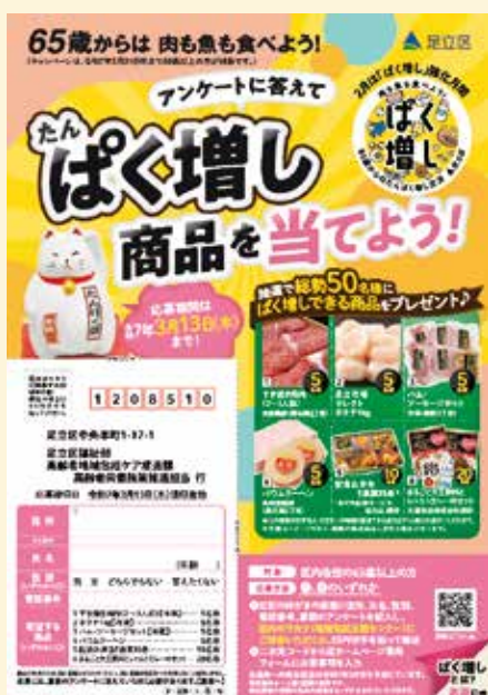
専用はがき付き応募用紙