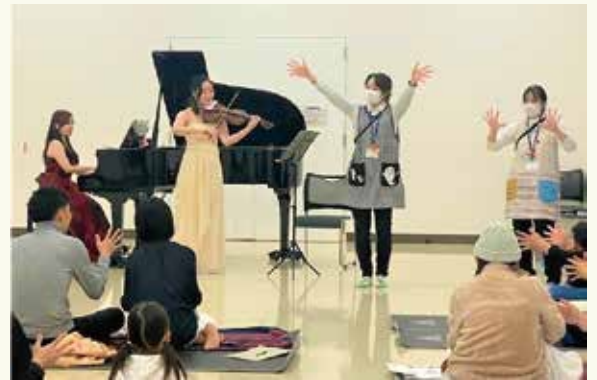
壮大な音楽にあわせて、手遊びも自然とダイナミックに

最後は「情熱大陸」で華やかに幕を閉じた、ふれあいコンサート。親子で楽しめるイベントを、今後もご期待ください。