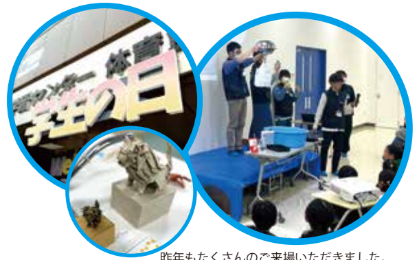
昨年もたくさんのご来場いただきました。

テーマは2023年の「和」、2024年の「サイエンス」からガラッと変わり、今回は「音楽とダンス」です。お楽しみに。