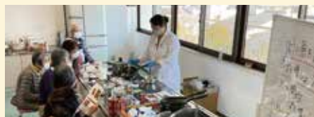
ぱく増し講座では、実践的なメニューの試食があります。