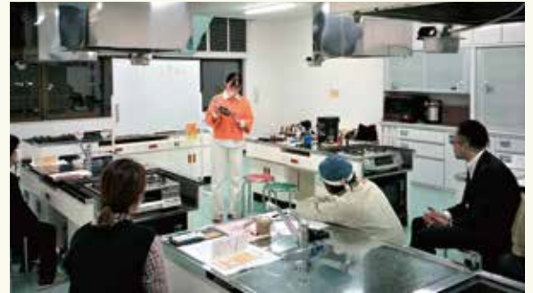
講師の説明を真剣に聞いているみなさん

会場にはコーヒー関連本を数多く展示し、多くの方に手に取ってもらいました。図書館ではコーヒーに関する本も沢山所蔵しているので、ぜひ来館ください。