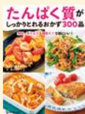
『たんぱく質がしっかりとれるおかず 300品』

や魚介、卵などを使用したおかずの作りおきや、お弁当に取り入れやすいレシピが満載。野菜もいっしょに摂れる、栄養バランスのよいレシピも多いので是非参考にしてみてください。