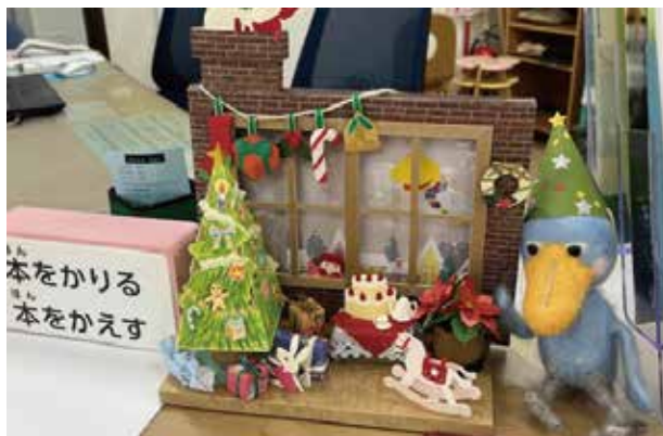
子どもに人気のカウンター装飾