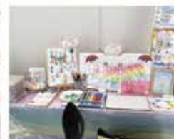
ご参加いただいた作家のみなさん、ありがとうございました！