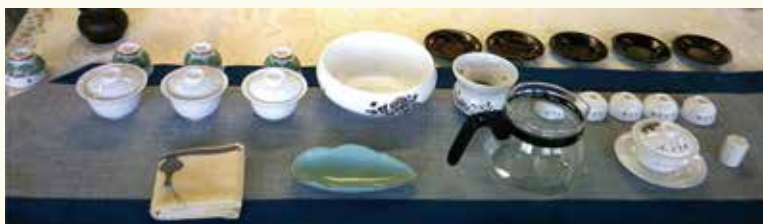
華やかな茶器も魅力のひとつ