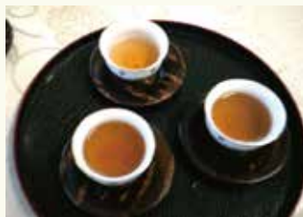
淹れた回数で色が変わります。

中国茶の基本や作法を学んだあと、先生の淹れ方を見てから実際に参加者のみなさんにもお茶を淹れていただきました。中国茶は、茶葉に数回お湯を継ぎ足して味や香りの変化を楽しむのが魅力で、淹れる人によっても味わいが変わるのが特徴です。先生が淹れたお茶を飲んだ参加者からは、「味がこんなに違う！」と驚きの声があがっていました。