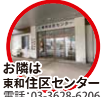
お隣は 東和住区センター 電話:03-3628-6206