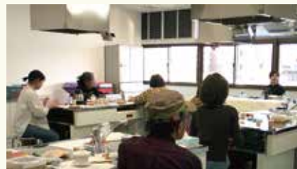
先生の話熱心に聴くみなさん